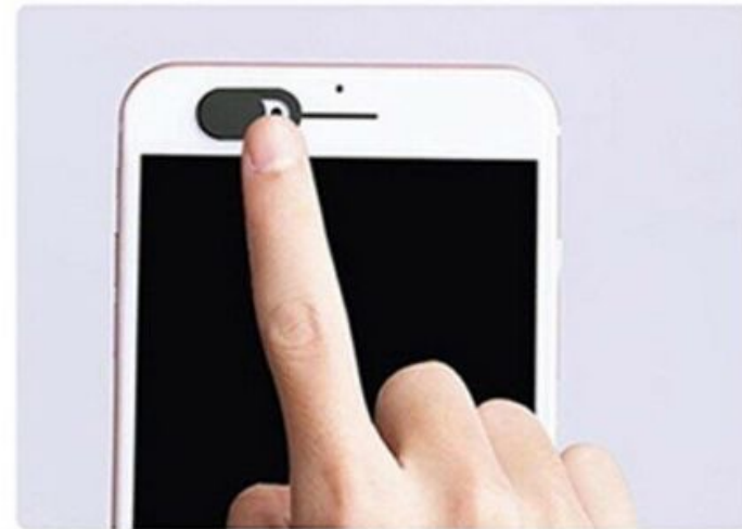
4. Öffnen und Schließen durch verschieben