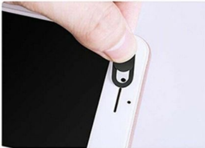
3. Platzierung der Schutzvorrichtung