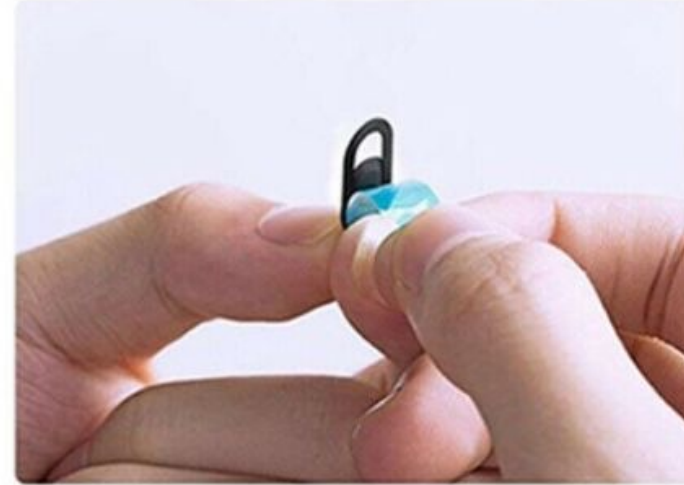
2. Entfernung der Schutzfolie