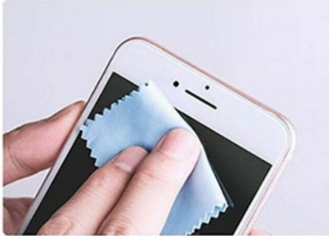
1. Betroffene Stelle reinigen