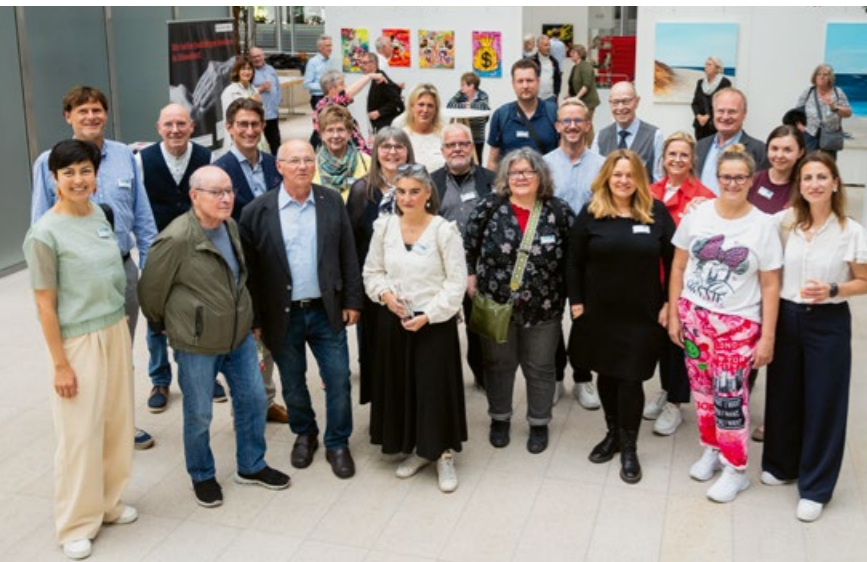
„KREATIVE GENERATIONEN 2024“ Mehr als ein Name: Die Künstler:innen selbst verkörpern mehrere Generationen und ein großes kreatives Spektrum.