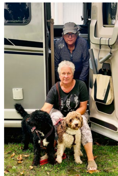
HELMUT WOMO ALLES RUND UMS WOHNMOBIL