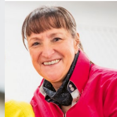
BEATE GRUPPE DATENERFASSUNG

ES IST JEDES MAL SCHÖN, DIE „HENKEL-GESICHTER“ WIEDER ZU SEHEN.