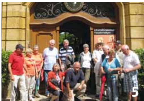
5: Die Regionalgruppe Thompson WÜ-N wanderte durch das Leinleiertal, besuchte die Landesgartenschau in Bamberg und besichtigte Vierzehnheiligen.