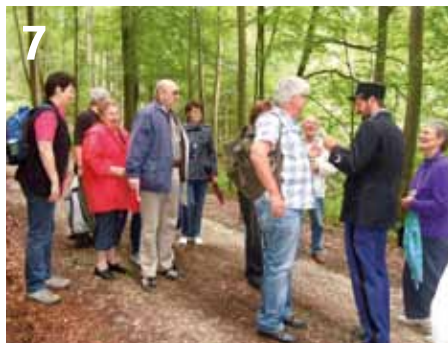
7: Eine heitere „Schmugglertour“ erlebte die Gruppe 138 im ehemaligen deutsch-französischen Grenzgebiet bei Hermeskeil.