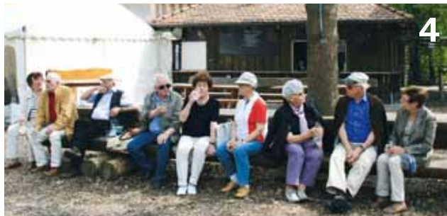
4: Eine Reise nach Bad Rappenau und Bad Wimpfen unternahmen die ehemaligen Markenartikler von Baden-Württemberg Nord.