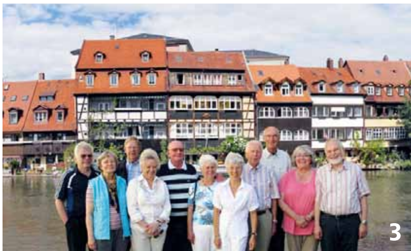
3: Vor dem Panorama von Bambergs „Klein-Venedig“ stellten sich die Pensionäre der BKK dem Fotografen.